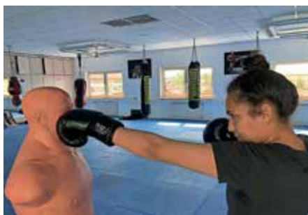
Selbstverteidigung für Erwachsene ab 13J

Das Bundeskriminalamt hat im ersten Halbjahr 2023 einen deutlichen Anstieg der Gewaltkriminalität in Deutschland registriert. Nach vorläufigen Daten der polizeilichen Kriminalstatistik kletterten die Zahlen im Vergleich zum Vorjahreszeitraum um rund 17 % nach oben, wie das Bundeskriminalamt mitteilte. Wir sollten nicht warten, bis wir Opfer werden und wir sollten auch nicht glauben, dass wir niemals Opfer werden.