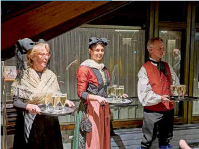
Die Markgräfler Trachtengruppe Hügelsheim kredenzt zu Beginn Sekt und nach dem offiziellen Teil Scharwaie und Hefezopf.